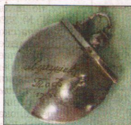
Зажигалка, 1944 год.