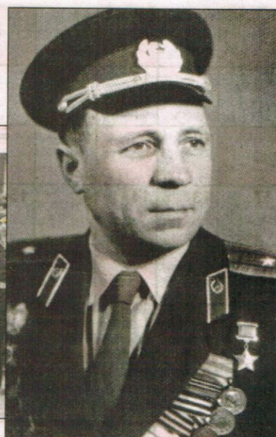
Александр Максимович Меркушев (1918–1991), Герой Советского Союза.