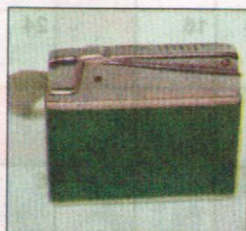
Зажигалка, 1970–е годы.