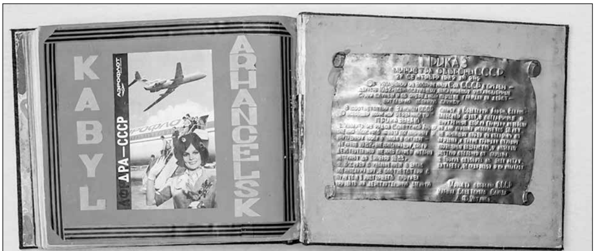
Рис. 4. Последние листы «дембельского альбома» С. П. Курицына.