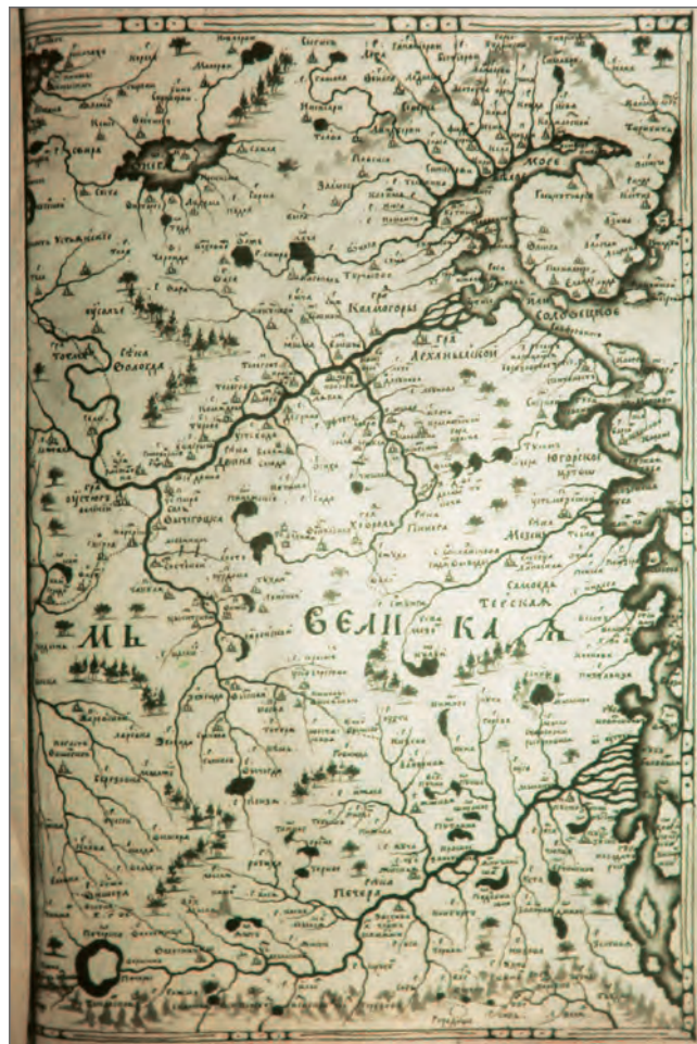
Карта 1701 года

Однако первый из этих документов был опубликован ещё в 1890 (!) г. [21], а вто-