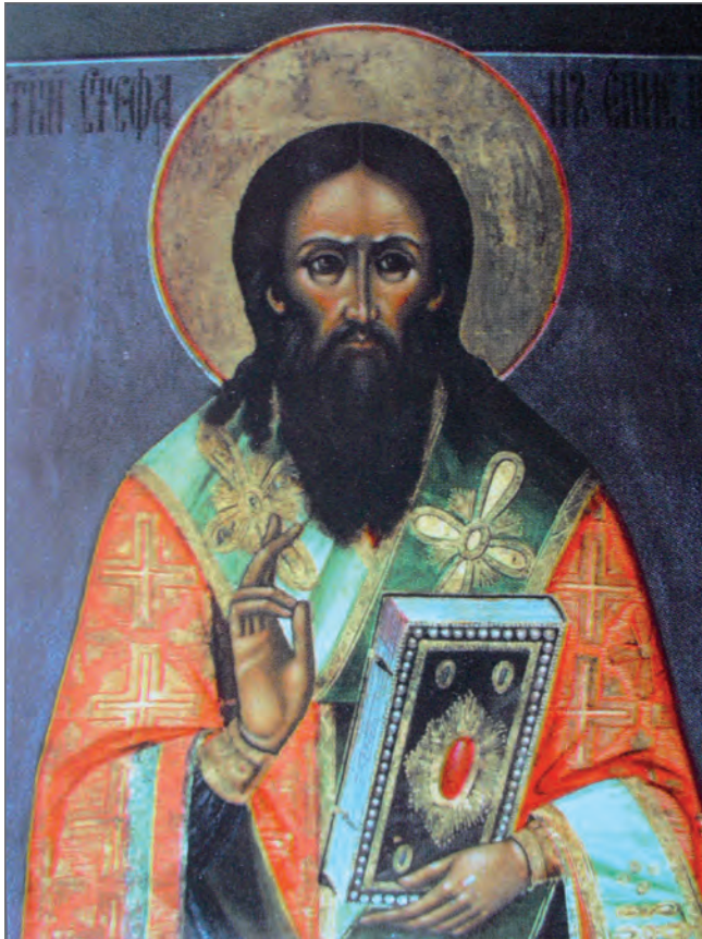
Карта 1701 года