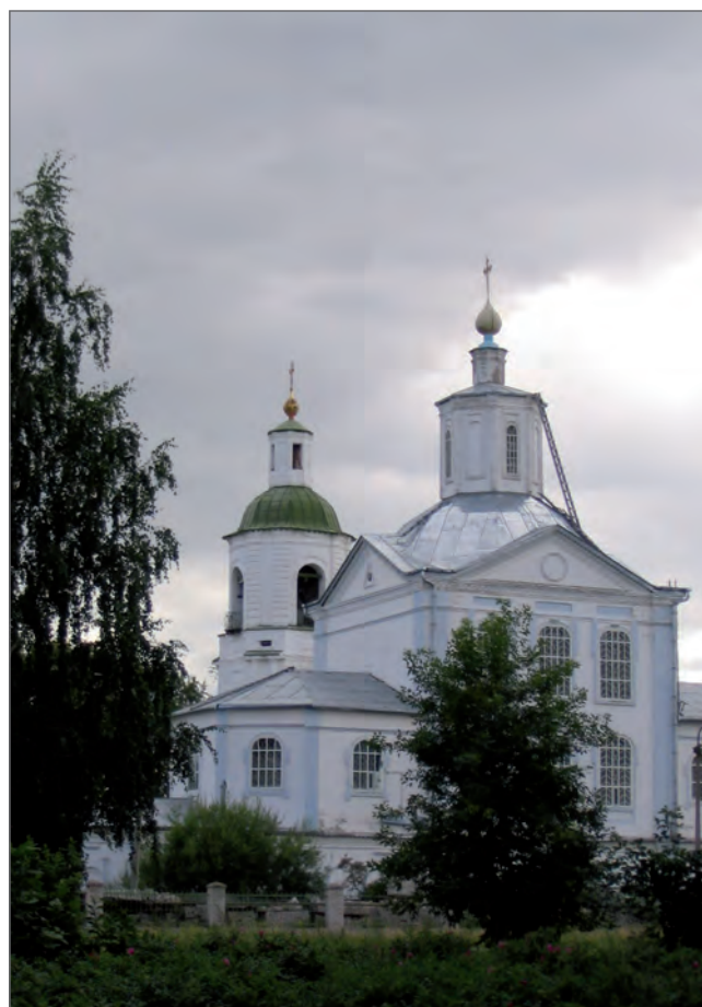
Стефановская церковь в Котласе