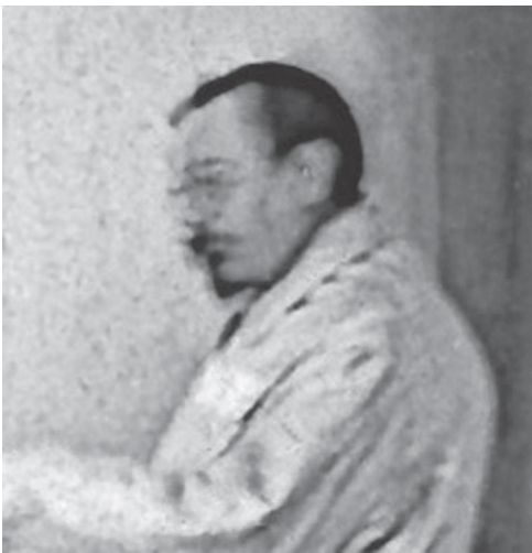
Рис. 1. Л. К. Гадомский.