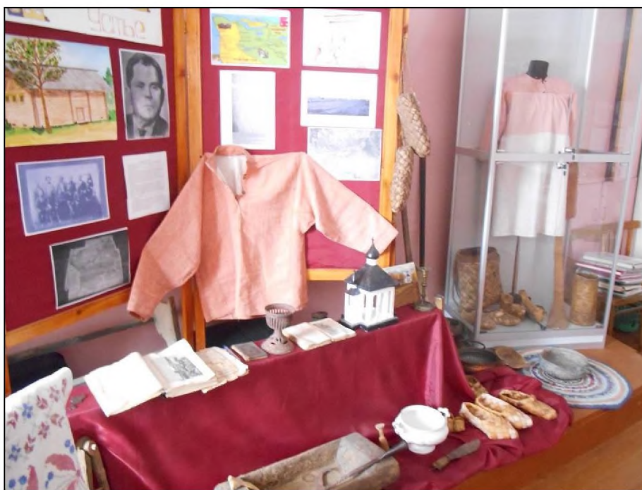
Музей «Макариха». Фрагмент экспозиции

движная выставка. Поддерживаются рабочие связи с Котласским краеведческим музеем, с местными органами власти. Для осуществления своей деятельности музей «Макариха» выигрывал городские и областные гранты. Активисты музея получили финансовую помощь в осуществлении проекта «Я – маленький котлашанин». Ученики 8-х классов выступили в качестве авторов, художников. На основе архивного материала они создали книгу для детей младшего школьного возраста «История Котласа в рассказах для детей». 400 экземпляров книги вышли из типографии и подарены в детские сады, школьные библиотеки. Данные примеры показывают, что с помощью музея «Макариха» школьники принимают участие в серьёзных, социально значимых делах. Так формируется их гражданское самосознание.