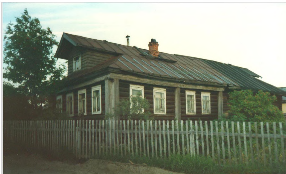
Дом Квасниковых (Мартемьяновская, 7). 1997 год

Выходя из жилой части дома, попадаешь на холодный мост. Здесь несколько дверей: одна дверь закрывает кладовку с огородным инвентарём, другая дверь закрывает кладовку продуктовую: на полках молоко, творог, сметана, масло, мука, соль, сахар, чисто вымытые кринки, банки. Сбоку на холодном мосту две ступеньки и закрытая дверь. Это вход на сеновал (повить), а там лестница на чердак, где осенью и зимой сушится бельё, а летом сушатся лекарственные травы, сушится и обрезается лук, а летом так сладко спится под звуки капель дождя. Здесь находится большой запас муки, мыла, крупы. Но лучше всего спать на повети, на ароматном сене, вдыхая аромат северного лета, сквозь сон слыша, как о подойницу бьются первые струйки парного молока из-под рук бабушки, квохтанье куриц, снесших яйца, и глухие вздохи сытой коровушки Мальки.