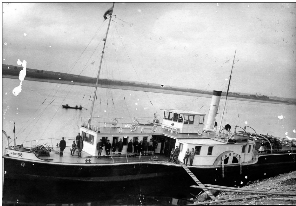
№ 1241 КП1 о.ф.