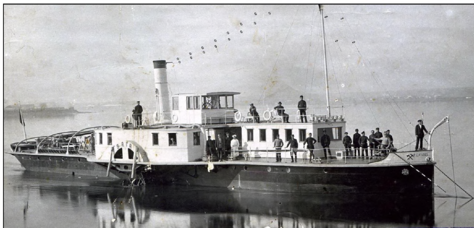
№ 3592 КПЗ о.ф.