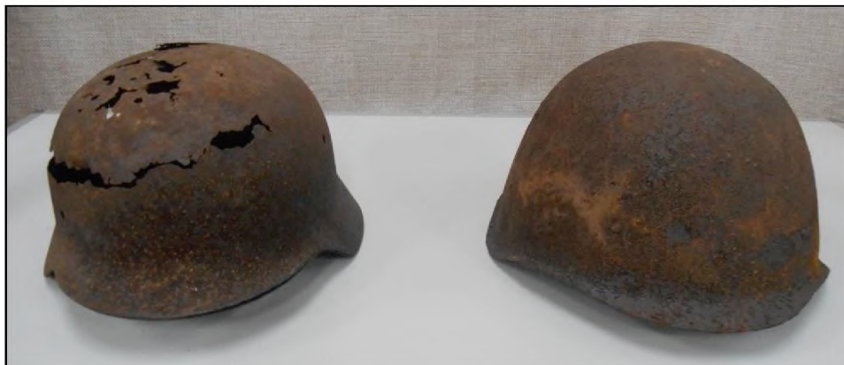
Музей «Макариха». Две каски