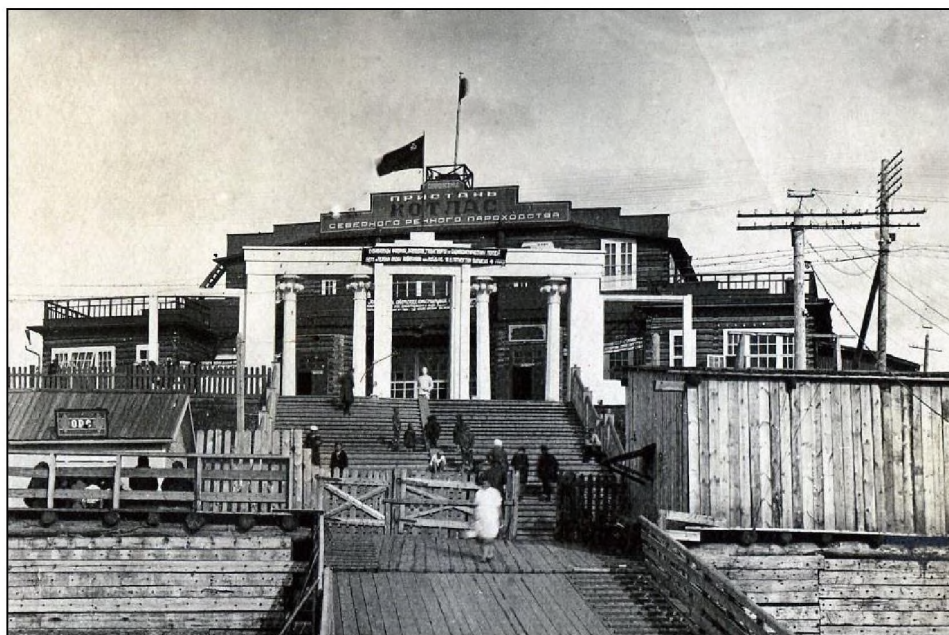
Пристань Котлас. 1950-е гг.